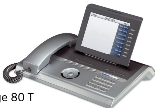
OpenStage 80 T