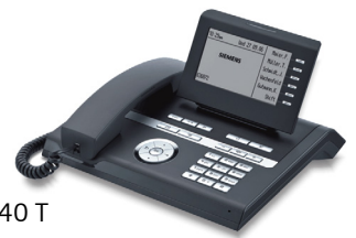
OpenStage 40 T