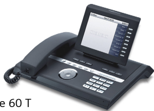
OpenStage 60 T