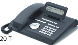
OpenStage 20 T