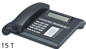
OpenStage 15 T

Työntekijöillä voi olla käytössään useita erilaisia työkaluja, kuten tietokone, matkapuhelin, PDA tai sankaluuri. OpenStage-puhelimien kattavien liitännämahdollisuuksien ansiosta voit yhdistää useimmat laitteet puhelimeesi (esim. USB- ja bluetooth-liitäntä). Innovatiivinen sovitinkonsepti mahdollistaa työpisteeseen laajentamisen esim. toisella puhelimella, faksilla tai vieraspuhelimella. Käytettävissä on myös OpenStage -lisänäppäimistö, joiden näppäimiin voi tallentaa esim. työntekijöiden pikavalintapainikkeita.